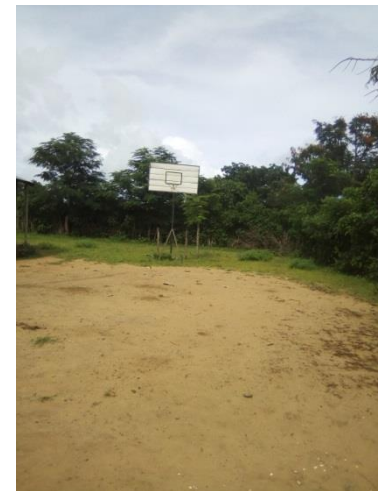
Terrain EPP Irodo