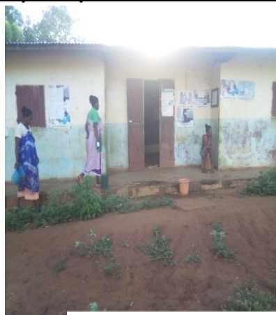
CSB II Ankarongana